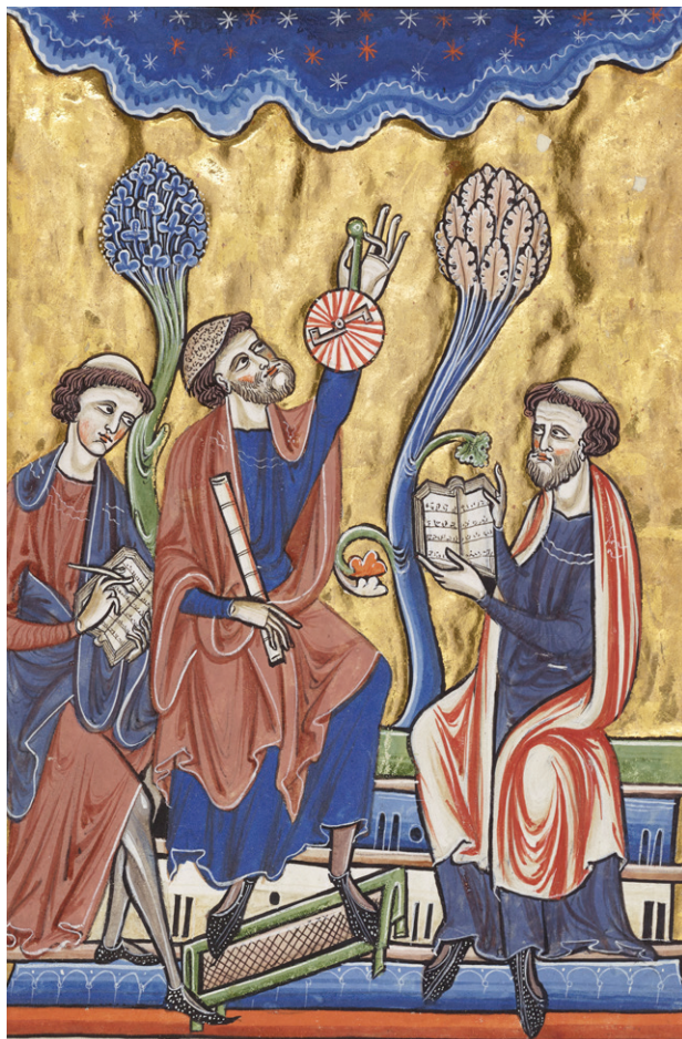
Ci-dessus : Psautier de Blanche de Castille · Paris, Bibliothèque de l'Arsenal, ms 1186 réserve, fol. 1v, détail